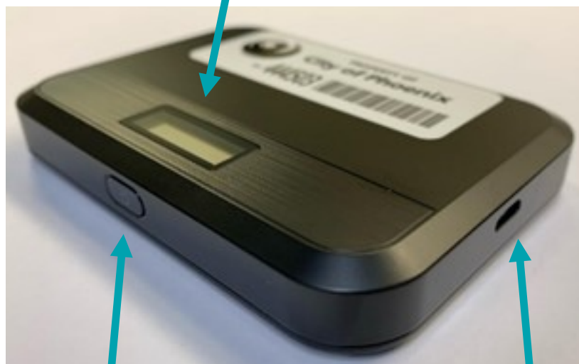
El Botón de Encendido/Menú